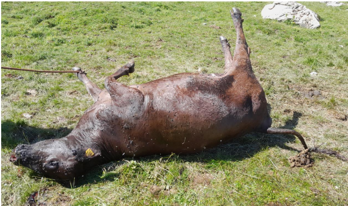
Abbildung 2: Durch Wölfe des Beverinrudels im Juli 2022 gerissene Mutterkuh.

Drei männliche Wölfe (M225, F112, M275) wurden auf der A13 zwischen Chur und Maienfeld überfahren.